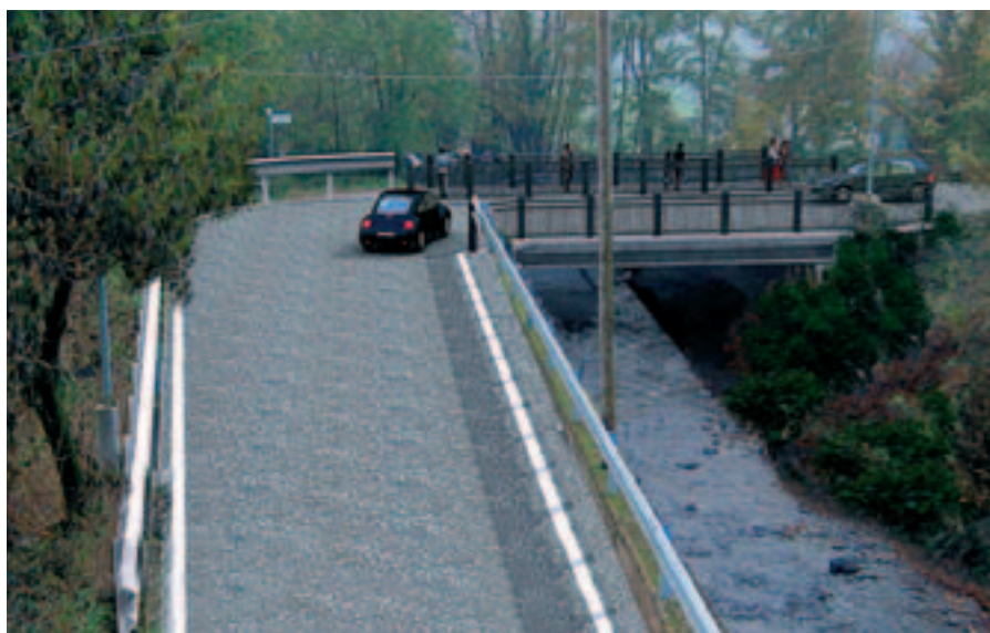
Ponte Arpega: previsione futura

Con l'obiettivo di ottenere una soluzione funzionale, ma nello stesso tempo economicamente accettabile, è stato previsto di mantenere il vecchio manu-