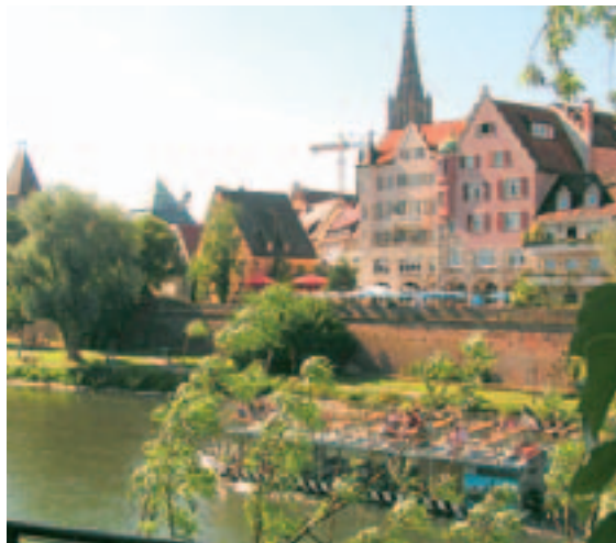
Neu-Ulm, la città gemellata con Trissino

Gli amici tedeschi se ne sono andati da poche settimane e già alcuni ragazzi trissinesi si chiedono: "A quando la prossima avventura?"