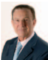
Dott. Vinicio Perin - Sindaco