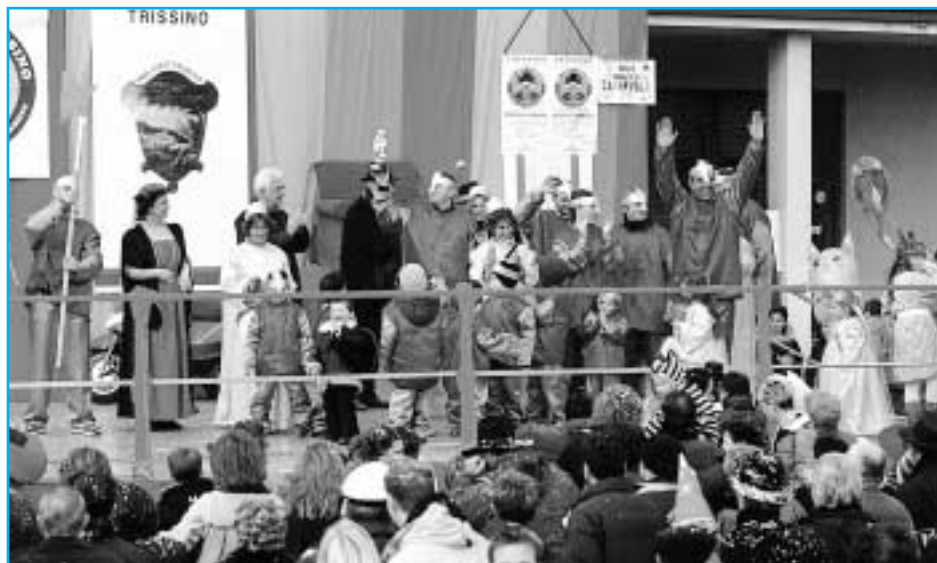
Un momento della sfilata dei Carri

Per informazioni telefonare allo 0445/962.155 (Roberta), allo 0445/490.242 (Roberto) o allo 0444/695.645 (Gigi).