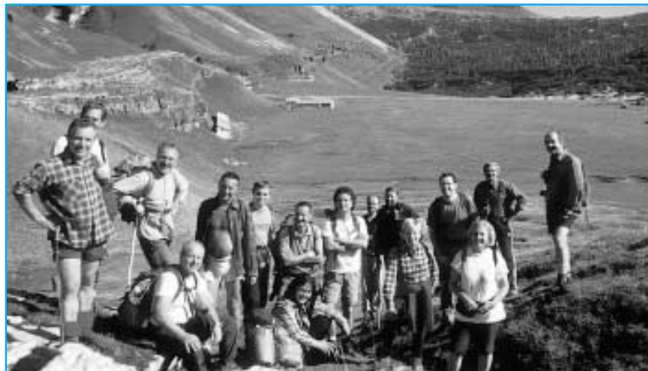
Il gruppo G.E.T. ai Piani Eterni