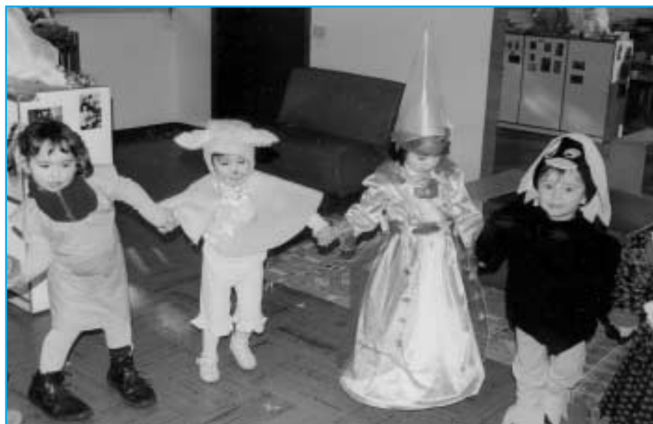
Un momento di festa al Nido

Il comune di Trissino non ha un proprio asilo nido, ma è stata lodevolmente stipulata una convenzione con il comune di Cornedo per