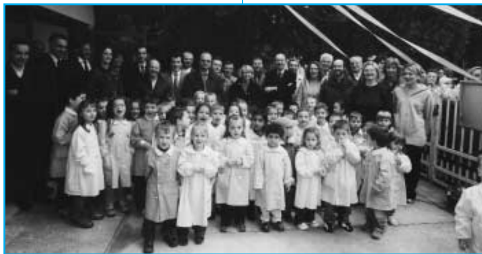
Nuova sezione Scuola Materna Selva