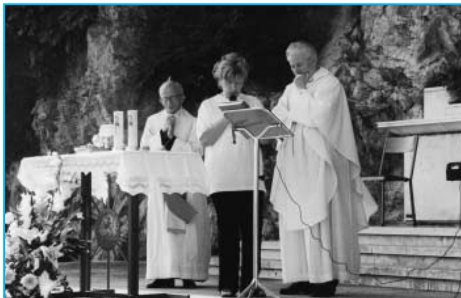
Celebrazione della giornata U.N.I.T.A.L.S.I. - 14 settembre 2002

"Per me è difficile parlare di tutto questo ed entrare nell'intimo del mio vissuto, che è iniziato con la nascita di mio figlio ed è proseguito negli anni. Anch'io come altre persone mie conoscenti ho provato la sofferenza vivendo con questo figlio l'esperienza della disabilità, e l'ho sperimentata nella varie fasi della crescita. E' stato difficile affrontare le difficoltà da sola; quante lacrime nascoste in queste vie tortuose, ma una di queste mi ha portato a conoscere altre mamme con i miei stessi problemi, con le stesse ansie, preoccupazioni, con il pensiero dell'oggi e del domani per i