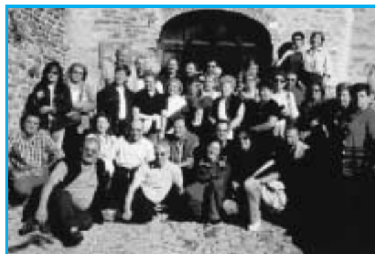
Il gruppo G.E.T. ritratto nel tour delle Langhe