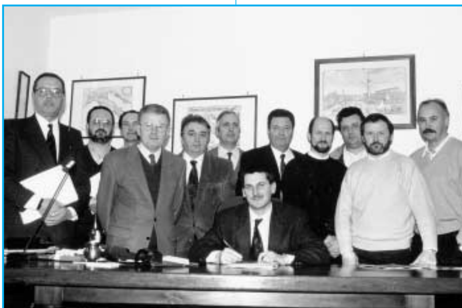
Soci fondatori Pro Loco